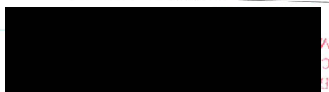
Múzeum mesta Bratislavy Zuzana Palicová